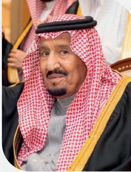
الملك سلمان بن عبدالعزيز آل سعود خادم الحرمين الشريفين